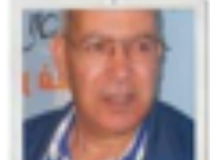
بوكير أركو رئيس المنظمة المغربية لحقوق الإنسان