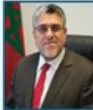
السيد وزير الدولة المكلف بحقوق الإنسان والعلاقات مع البرلمان