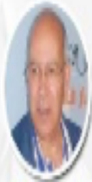
الأستاذة هويدا لؤلؤ رئيسة المنظمة العربية لحقوق الإنسان