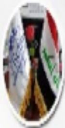
عائلة لؤلؤ شحيد رئيسة منظمة كيان لحقوق الإنسان، لبيروت - لبنان