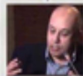
عبدالعزيز سارت فاعل جمهوي، رئيس التحالف العالمي للمغاربة الخارج