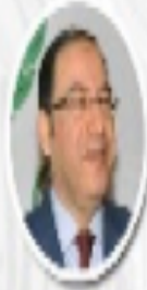
الدكتور أحمد شحيد رئيس مركز البحوث العربية لحقوق الإنسان