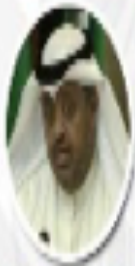
الأستاذة أمينة سليمان التايح رئيسة اللجنة العربية الدائمة لحقوق الإنسان