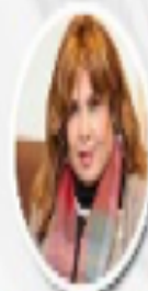
الأستاذة الدكتورة المصطفى المصطفى رئيسة اللجنة العربية الدائمة لحقوق الإنسان