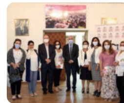
Rencontre avec M. Nizar Baraka, Secrétaire Général du Parti de l'Istiqlal