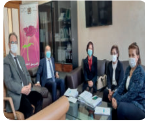
Rencontre avec M. Abdelhamid Fatihi, Président du groupe socialiste à la Chambre des conseillers