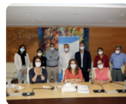
Rencontre avec M. Nabil Benabdellah, Secrétaire Général du PPS