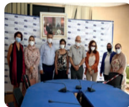
Rencontre avec M. Abdellatif Ouahbi, Secrétaire Général du PAM