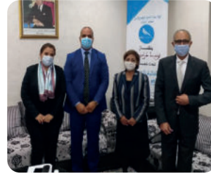
Rencontre avec M. Taoufik Kamel, président du groupe de l'Union Constitutionnelle à la Chambre des Représentants