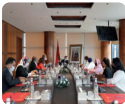
Rencontre avec M. Saadeddine El Otmani, Chef du Gouvernement

Le Collectif a mené une série de rencontres de plaidoyer visant à impliquer toutes les parties prenantes de ce projet sociétal : membres du gouvernement, leaders des partis politiques, de centrales syndicales et d'organisations de la société civile. La délégation du Collectif a également présenté et remis lors de ces rencontres, le livre blanc et le mémorandum sur les principales revendications et propositions en matière de parité.