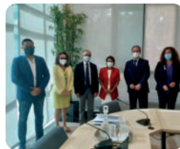
Rencontre avec M. Chakib Benmoussa, Président de la Commission Spéciale sur Nouveau Modèle de Développement