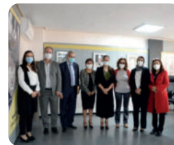
Rencontre avec M. Mohand Laenser, Secrétaire Général du MP