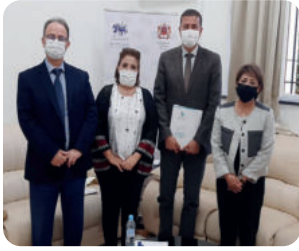
Rencontre avec M. Rachid El Abdi, président du groupe du PAM à la chambre des représentants