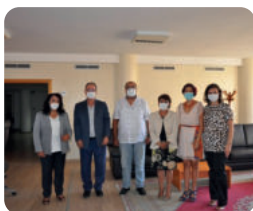
Rencontre avec M. Driss Lachgar, Secrétaire Général de l'USFP