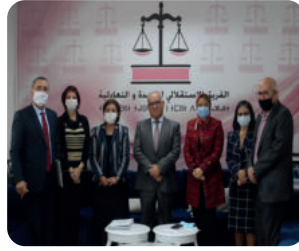
Rencontre avec M. Noureddine Mediane, président du groupe de l'Istiqlal à la Chambre des Représentants